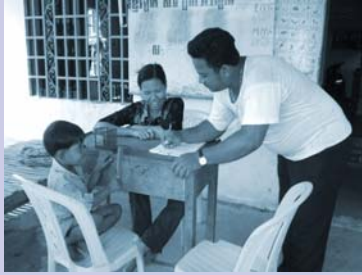
ការរៀបចំសំណើរលើហេដ្ឋារចនាសម្ព័ន្ធ Preparing infrastructure proposal.