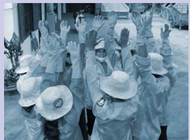
ក្រុមរៀបចំប្រមូលសំណល់នៅពេលព្រឹក Preparing for morning collection work.