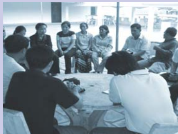
បុគ្គលិកពិនិត្យមើលកម្មវិធីឡើងវិញ Staff during program review session