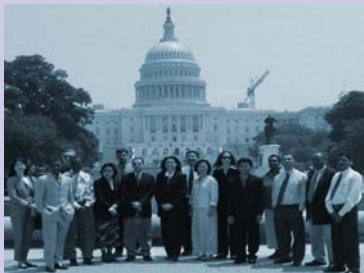
នាយកអង្គការ(ស្ត្រី) (ទី៥ ពីខាងឆ្វេង) នៅក្នុងសហរដ្ឋអាមេរិក