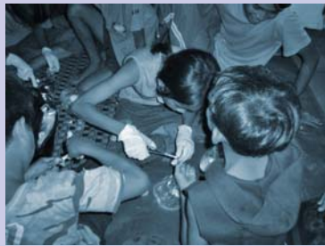
ការថែរក្សាបឋមពីកុមារទៅកុមារ Child to child first-aid care.