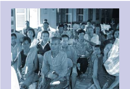
ការប្រជុំសហគមន៍ Community meeting

អ្នកតំណាងសហគមន៍(CDCs)ជាច្រើន បានចូលរួមយ៉ាងសកម្ម ក្នុងកិច្ចប្រជុំប្រចាំត្រី មាស នៅឯការិយាល័យអង្គការ(ស្តារ៉ូ) ។ ជាមធ្យមមានប្រជាពលរដ្ឋចំនួន ៣២ នាក់ បានចូលរួម កិច្ចប្រជុំដ៏រស់ រវើកដែលមានរយៈពេលកន្លះថ្ងៃ ទាំងនេះដើម្បីធ្វើការពិភាក្សាទៅលើយុទ្ធសាស្ត្រនានា, កំណត់រកនូវ បញ្ហារួម និង ធ្វើការផ្តល់ប្តូរទិសដៅទៅវិញទៅមក។ ប្រធានបទមួយចំនួន ដែលបាន ពិភាក្សា នាអំឡុងពេលឆ្នាំ ២០០៤ រួមមាន បញ្ហានានាដែលសហគមន៍ទីក្រុងក្រីក្រជួបប្រទះ, របៀបធ្វើការ អភិវឌ្ឍន៍ផែនការយុទ្ធសាស្ត្រសហគមន៍, ការប្រមូលផ្តុំការចូលរួមរបស់សហគមន៍, វិធីសាស្ត្រ ផ្សេងៗគ្នាចំពោះការធ្វើផែនការ សកម្មភាព អោយមានភាពប្រសើរឡើង និង លើរបៀបធ្វើទំនាក់ទំនង ជាមួយអាជ្ញាធរមូលដ្ឋាន។