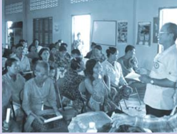
ការប្រជុំជាមួយសហគមន៍ថ្មី Meeting with a new community.