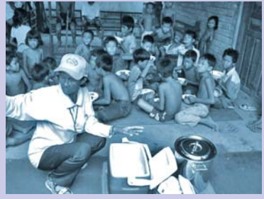
ការញ៉ាំអាហារសំរីន់បន្ទាប់ពីវគ្គសិក្សា Snack after curbside session