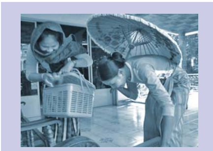
បុគ្គលិករៀនដើរតួនាទីសំរាប់អំពីយេនឌ័រ Gender role-play during staff training.

ដើម្បីធានានូវការកសាងសមត្ថភាពបុគ្គលិកអោយមានជាបន្ត មន្ត្រី IDP បានអនុវត្តការវាយតម្លៃលើសេចក្តីត្រូវការនៃការបណ្តុះបណ្តាល ទៅលើ បុគ្គលិកសំខាន់ៗទាំងអស់។ ដោយផ្អែកលើលទ្ធផលនៃការវាយតម្លៃនេះ សកម្មភាពបណ្តុះបណ្តាលមួយចំនួន ត្រូវបានរៀបចំឡើង។ កម្មវិធី បណ្តុះបណ្តាលវគ្គខាងក្នុង បានរៀបចំសិក្ខាសាលាចំនួនពីរ លើវគ្គគ្រូបង្វឹកគ្រូ (ToT) ដែលបានរៀបចំឡើងសំរាប់បុគ្គលិកកម្មវិធីអង្គការ(ស្ត្រី) ចំនួន ១២ នាក់។ វគ្គសិក្សាបណ្តុះបណ្តាលខាងក្រៅ មានរយៈពេល ៤៨ ម៉ោង ស្តីពីការពង្រឹងគោលនយោបាយបរិស្ថាន ធ្វើនៅក្រសួងបរិស្ថាន សំរាប់មន្ត្រីកម្មវិធី SWM របស់អង្គការ(ស្ត្រី), វគ្គបណ្តុះបណ្តាលលើជំនាញសរសេររបាយការណ៍រយៈពេល ៤២ ម៉ោង ដល់មន្ត្រីរដ្ឋបាលរបស់អង្គការ(ស្ត្រី) នៅ វិទ្យាស្ថានបណ្តុះបណ្តាលឯកជនមួយ, វគ្គបណ្តុះបណ្តាលលើជំនាញគណនេយ្យ ដែលមានរយៈពេល ៤០ ម៉ោង ដល់អ្នកជំនួយការគណនេយ្យរបស់អង្គការ(ស្ត្រី) នៅ អង្គការ SILAKA និង វគ្គបណ្តុះបណ្តាល- លើការការពារ និង ការជួញដូរកុមារ មាន រយៈពេល ៤០ ម៉ោង ដល់បុគ្គលិកកម្មវិធី MOE របស់អង្គការ(ស្ត្រី) ជាមួយ អង្គការសិទ្ធិកុមារមួយ។