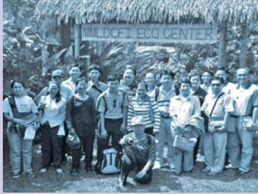
ក្រុមទស្សនៈកិច្ចសិក្សានៅប្រទេសហ្វីលីពីន Exposure trip to Philippines.