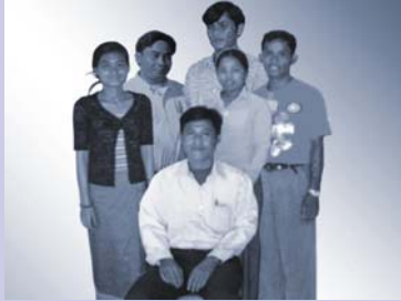
បុគ្គលិកថ្មី New staffs