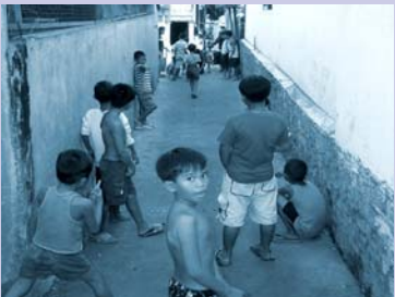
កុមារនាំគ្នាលេងលើផ្លូវប្រកតូចដែលធ្វើរួចហើយ Children play on improved alley

To further strengthen the capacity of CDC members, CSARO provided a two and a half day training in February for 30 participants on leadership skills, community organizing, participatory problem solving and strategies for communicating with local authorities.