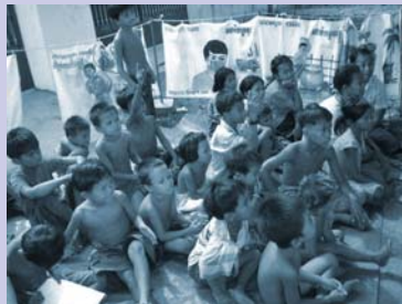
វគ្គសិក្សាអប់រំសហគមន៍ Community education session

To give students of the non-formal education program an opportunity to get out of the city, experience nature and learn about a new environment, the MOE program organized a one-day field visit to the seaside in Kampot Province. Participants included 45 of the most active students and 4 adults. The group studied flora and fauna with program staff. Another enrichment activity assisted 45 waste picker children and 5 adults to participate in International Children's Day celebrations in Phnom Penh on the first of June.