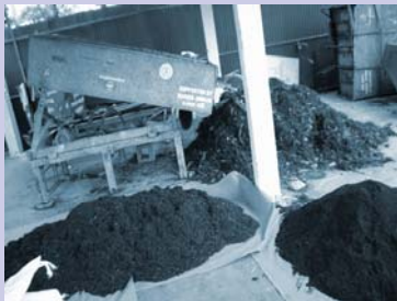
លទ្ធផលដឹកប៉ុស្តិ៍ផលិតបាន Processed compost.

Since 2001, CSARO has been a leader in developing and promoting an innovative model of manual, door-to-door waste collection and waste sorting for compost production and recovery of recyclable materials. This program was first piloted in an area called the NIP zone in the southern part of the city, and was gradually expanded to 6 areas. The system was very successful at creating employment for waste picker groups, increasing resource recovery and improving sanitation in low and medium income neighborhoods.