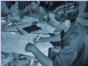
វគ្គបណ្តុះបណ្តាលបុគ្គលិក Staff training session

The IDP is a new initiative of CSARO to consolidate the internal capacity building activities of the former Human Resource Development program and some personnel and administrative functions. Another important role of IDP is to assess and improve CSARO's internal procedures and policies with the aim of streamlining operations and making the organization more efficient.