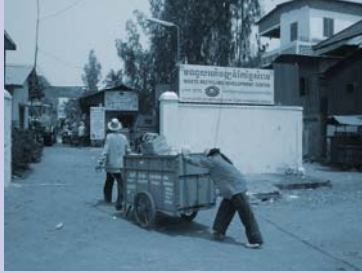
ការដឹកជញ្ជូនសំរាមទៅកាន់មណ្ឌល Bringing waste to the WRDC.