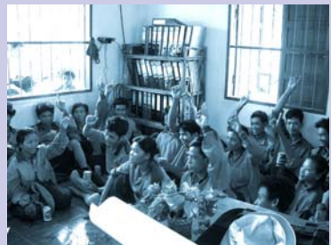
សមាជិក SHG អនុម័តលើកិច្ចសន្យា SHG members vote on contract.

នៅក្នុង ខែមករា, អ្នកម៉ៅការប្រមូលសំណល់កជន បានផ្លាស់ប្តូរការគ្រប់គ្រង ហើយសំរេចឈប់បន្តកិច្ចសន្យាប្រមូលសំណល់របស់ក្រុមជួយខ្លួនឯង (SHGs)។ នៅក្នុង ខែកញ្ញា សាលាក្រុងបានផ្ទេរសេវា ប្រមូលសំណល់នៅក្នុងតំបន់(NIP) ទៅអោយអ្នកម៉ៅការកជន។ ហើយនៅខែ តុលា អង្គការ(ស្តារ៉ូ) បាន ដក ខ្លួនចេញយ៉ាង ស្ទាត់ស្ទើរ ពីកម្មវិធី (JFPR) បន្ទាប់ពីការខកខាន ក្នុងការឈានទៅដល់កិច្ច ព្រមព្រៀងជា មួយថ្នាក់គ្រប់គ្រងក្រុង ទៅលើថវិកាសំរាប់ដំណាក់កាលបន្ទាប់នៃការងារ។ ជាលទ្ធផលនៃ ការប្រែប្រួលទាំងនេះ កិច្ចសន្យាប្រមូលសំណល់ទាំងអស់ ដោយ ក្រុមជួយខ្លួនឯង (SHGs) ត្រូវបានបិទជាបណ្តើរៗ ពីខែ មករា រហូតដល់ចុងខែតុលា។ សមាជិកក្រុមជួយខ្លួនឯង (SHG) ខ្លះទទួលបានការងារធ្វើជាមួយអ្នកម៉ៅការដឹកសំណល់ ប៉ុន្តែ ភាគច្រើនគ្មានការងារធ្វើទេ។