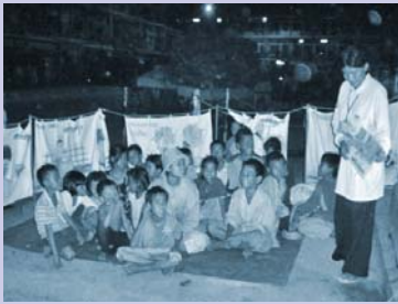
វគ្គសិក្សាតាមចិញ្ចើមផ្លូវនាពេលយប់ Nighttime curb-side session

To raise awareness and address the special needs of female waste pickers, CSARO staff organized group discussions and counseling sessions with 32 women and 21 girls. Topics included reproductive health, family planning, human trafficking, sexual abuse and domestic violence. 10 women and 5 girls were referred to a women's health center for consultation.