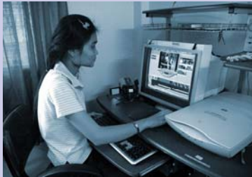
ការពិនិត្យផ្លែឆ្កែផ្លាស់លើវីដេអូ Video editing.