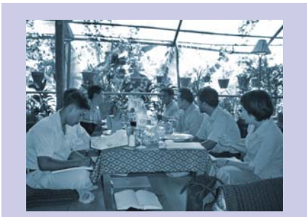
ការប្រជុំក្រុមប្រឹក្សាភិបាលអង្គការ(ស្តារ៉ូ) CSARO board meeting.

នៅចុងខែ វិច្ឆិកា, មន្ត្រីកម្មវិធីអង្គការ(ស្តារ៉ូ) ទាំងអស់ បានចូលរួម និង សំរបបសំរួលប្រជុំរយៈពេលកន្លះថ្ងៃជាមួយទីព្រឹក្សាពិគ្រោះយោបល់ ដើម្បីពន្យល់លើការបញ្ចប់ផែនការបីឆ្នាំ ដែលពិនិត្យឡើងវិញរួចហើយ របស់អង្គការ(ស្តារ៉ូ) និង ដាក់ការពិនិត្យតាមដានលើឯកសារកម្មវិធីថ្មី។