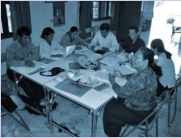
វគ្គគ្រូបង្វឹកគ្រូ Training of Trainers session