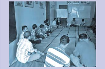
ការហ្វឹកហ្វឺនគណៈកម្មការអភិវឌ្ឍន៍សហគមន៍ Community development committee training