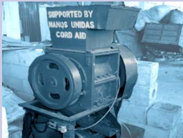
ម៉ាស៊ីនកិនដីប្លាស្ទិកថ្មី New plastic shredder

In the first six months of 2004, SHGs collected more than 3600 tons of waste within the NIP area (the original collection pilot area). The waste was brought to the SHG managed CSARO Waste Recycling Development Center, where 150 cubic meters of organic waste was converted into compost and more than 100 cubic meters of recyclable materials were sorted. Income from waste collection and the sales of recyclable materials and compost paid salaries and covered expenses, any surplus went into the SHG bank account to support member loans and medical costs. During 2004, total SHG income in the NIP was $8213, with more than $4500 reserved in the bank. SHG members received training on bookkeeping and management skills to increase self-reliance.