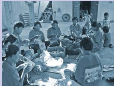
ការផលិតសំភារៈកែច្នៃដោយដៃ Making handicrafts from recycled materials.