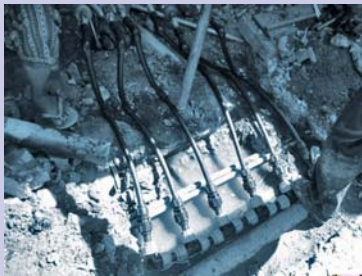
ការតម្រូវទឹកផ្គត់ផ្គង់ទឹកស្អាត Water supply installation.