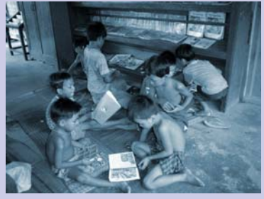
កុមារប្រើប្រាស់បណ្ណាល័យក្នុងមណ្ឌលWPDC Children use WPDC library.