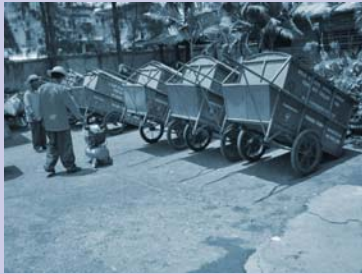
រទេះរុញប្រមូលសំរាមថ្មី Improved pushcarts for waste collection.