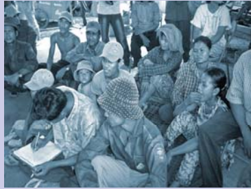
ការប្រជុំប្រចាំត្រីមាសរបស់ SHGs Quarterly meeting of SHGs