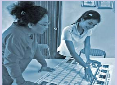
ពិភាក្សាលើការរចនាប្រក្រតិទិន Discussing calendar design.

ការរៀបចំបង្កើតបណ្តាញធនធានសហគមន៍, មន្ត្រីកម្មវិធី(CRC) បានប្រមូល ឯកសារនានា នៅក្នុងអង្គការ(ស្តារ៉ូ) ដូចជារបាយការណ៍សកម្មភាពការងារ, របាយការណ៍ទស្សនៈកិច្ចសិក្សា, ឯកសារ ស្រាវជ្រាវ និង ករណីសិក្សាក្រុមគោលដៅ ក្នុងកម្មវិធីអង្គការ(ស្តារ៉ូ)និមួយៗ។ នៅពេលចុងឆ្នាំ ប្រព័ន្ធ បញ្ជីរាយឈ្មោះសៀវភៅបណ្តាញធនធាន (catalogue) កំពុងត្រូវបានបង្កើតឡើង។