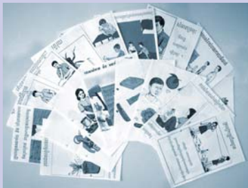
សំភារៈអប់រំ Educational materials.

The CRC program is a new initiative of CSARO to consolidate the production of Information, Education and Communication (IEC) materials formerly produced by the old Hygiene Awareness Program, and to create a documentation program and resource library. The documentation component will coordinate research on present and past CSARO activities, while the community resource library will collect documents from CSARO and other sources and make them available to CSARO community partners, program staff, collaborating NGOs, and others. Launch of this program was delayed by difficulties in recruitment of appropriate staff.