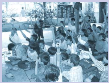
ការអប់រំក្រៅប្រព័ន្ធនៅមណ្ឌល WPDC Non-formal education at WPDC.

ក្នុងការលើកតម្កើងការអភិវឌ្ឍផ្នែកសង្គម និង សេដ្ឋកិច្ច, បុគ្គលិករបស់មណ្ឌល (WPDC) បានធ្វើការសំរាប់សំរួលជាមួយមនុស្សពេញវ័យអ្នករើសសំរាម(អេតចាយ) ដើម្បីបង្កើតជាសមាជិកក្រុមជួយខ្លួនឯង (SHGs) ។ ក្នុងអំឡុងរយៈពេលនេះ មានក្រុមចំនួន ៦ ត្រូវបានបង្កើតឡើងដោយ ក្រុមនិមួយៗមានសមាជិកចំនួន ៧ នាក់។ ក្រុមនិមួយៗ ធ្វើការប្រជុំ ដើម្បីជ្រើសរើសឈ្មោះសំរាប់ក្រុម និង ដើម្បីរៀបចំឡើងនូវគោលបំណងរបស់ក្រុម។ សមាជិកក្រុមជួយខ្លួនឯងជាច្រើន បានទទួលបានការបណ្តុះបណ្តាលជំនាញ ពីអង្គការ(ស្តារ៉ូ) លើការរៀបចំក្រុម, ភាពជាអ្នកដឹកនាំ, និង លើជំនាញផ្នែកកែច្នៃ ដូចជាការបែងចែកសំរាមជាចំណីគ្នា, ការផលិតជីកំប៉ុស្ត និង ការផលិតវត្ថុបាត់កម្មពីសំភារៈកែច្នៃ។ អ្នករើស