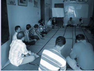
ការប្រជុំធ្វើគម្រោងផែនការ Project planning meeting.