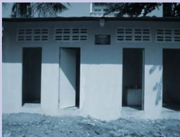
បង្អួចសាលារៀនដែលបានសាងសង់រួចហើយ Finished school latrine.

CSARO works in some of the poorest and most underserved areas of Phnom Penh. In the initial stages, CSARO's staff identify low-income areas of the city and help residents to organize meetings to identify their priority needs. Community Development Committees (CDCs) members are elected and trained so that they can plan and implement their own improvement projects. CSARO teams assist the communities to implement their projects and monitor the results.