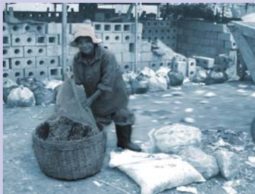
ការបែងចែកសំរាមនៅមណ្ឌល Sorting waste at the WRDC.