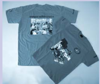
អារវិយ័តដែលមានន័យអប់រំ Educational t-shirts.