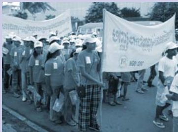
ទិវាកុមារអន្តរជាតិ Children's Day activities.

Growing up in the city's slums and resettlement communities, many residents lack awareness about proper waste disposal and sanitation. Working on the city's streets, waste picker children and adults have little time and few opportunities for education. CSARO's MOE program brings training and awareness activities on to the streets where the waste pickers work and into the low-income communities where the city's poor live.