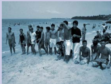
សមាជិក(SHG) កំសាន្តតាមឆ្នេរសមុទ្រ SHG members visit the seaside

To promote social and economic development, WPDC staff worked with interested adult waste pickers to form Self-Help Groups (SHGs). During this period, 6 new groups were formed with 7 members each. Each group held meetings to choose a group name and to set their goals. Members received skills training from CSARO on group organization and leadership, and on recycling skills including the classification and separation of waste, compost production, and creation of handicrafts from recycled materials. A total of 142 waste pickers took part in 19 different training workshops with hundreds of hours of training. During this year, graduates have started producing handicrafts and sold 239 items with marketing assistance from CSARO.