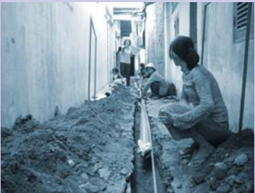
ការតបណ្តាញប្រព័ន្ធទឹកស្អាត Installation of new water supply.