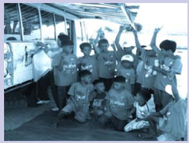
កម្មវិធីរថយន្តក្រុងMOEអប់រំតាមចិញ្ចើមផ្លូវ Curb-side education with MOE bus.

កម្មវិធីអប់រំផ្សព្វផ្សាយចល័ត (MOE) បានបង្កើតមេរៀនបណ្តុះបណ្តាលចំនួន ៣៣មេរៀន លើប្រធានបទដូចជា របៀបអាន និង របៀបសរសេរ, អនាម័យផ្ទាល់ខ្លួន, សំណល់គ្រោះថ្នាក់, សិទ្ធិកុមារ និង ការការពារបរិស្ថាន។ មេរៀននីមួយៗ បានប្រើប្រាស់លើវិធីសាស្ត្រក្នុងការបង្រៀនខុសៗគ្នា ដូចជា ចំរៀង, ការដើរតួសំដែងរឿង, ការពិភាក្សាក្រុម និង ការសំដែងសិល្បៈ។ ការតាមដានពិនិត្យមើលលើភាពរីកចំរើនរបស់សិស្ស និង ធ្វើអោយកម្មវិធីមានលក្ខណៈឆ្លើយតប, ប្រព័ន្ធវាយតំលៃលើចំណេះដឹងរបស់សិស្ស ដែលមានបីកំរិត ថ្មីមួយ ត្រូវបានសាកល្បងធ្វើឡើងនៅឆ្នាំ ២០០៤ ។ ប្រព័ន្ធពិនិត្យតាមដាននេះ បានទទួលជោគជ័យ យ៉ាងខ្លាំង ហើយនឹងត្រូវបានធ្វើការពង្រីកបន្ថែមនៅក្នុងឆ្នាំ ២០០៥ ។