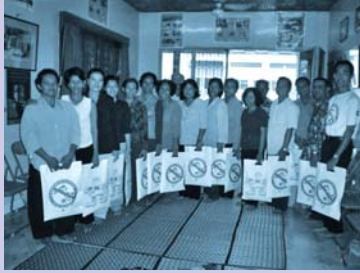
អ្នកសហគមន៍ទទួលការបណ្តុះបណ្តាល Community training.