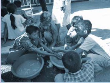
កុមាររើសសំរាម( អេតចាយ) លាងដៃ Waste pickers wash hands.