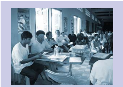
ការប្រជុំប្រចាំត្រីមាសCDCs CDCs quarterly meeting