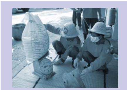
ការធ្វើជីកំប៉ុស្តដែលផលិតរួចហើយ Weighing finished compost.

នៅអំឡុងពេលនេះ, បុគ្គលិកកម្មវិធី (SWM) ក៏បានធ្វើការជាមួយសមាជិកក្រុម ជួយខ្លួនឯង (SHG) រៀបចំធ្វើរទេះរុញដែលមានគំរូថ្មីមួយចំនួនសំរាប់ការប្រមូលសំរាម, ម៉ាស៊ីនកិនជីវស្នូកថ្មី មួយ និង ធ្វើការកែលំអរបន្ថែមនូវម៉ាស៊ីនកិនសំរាមសំរាប់ធ្វើជីកំប៉ុស្ត ។